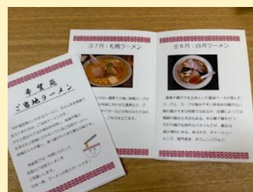
■ ラーメン小冊子 ■