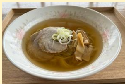
■ 函館ラーメン ■