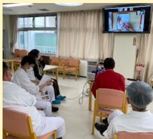
●ZOOMによるオンライン研修受講の様子

もっとおいしく!をモットーに、料理の知識やテクニック取得の為調理師の勉強会を実施しています。